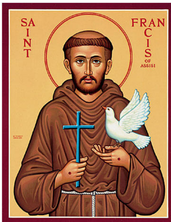
Den hellige Frans av Assisi